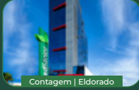
Contagem | Eldorado