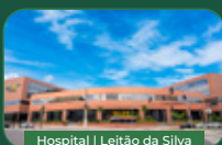
Hospital | Leitão da Silva