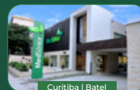
Curitiba | Batel