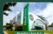
Brasília | Asa Sul