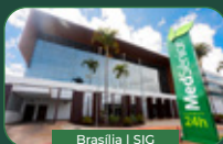
Brasília | SIG