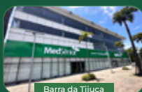
Barra da Tijuca