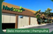
Belo Horizonte | Pampulha