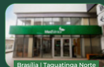
Brasília | Taguatinga Norte