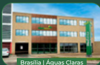
Brasília | Águas Claras