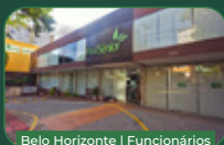
Belo Horizonte | Funcionários