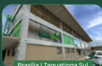
Brasília | Taguatinga Sul