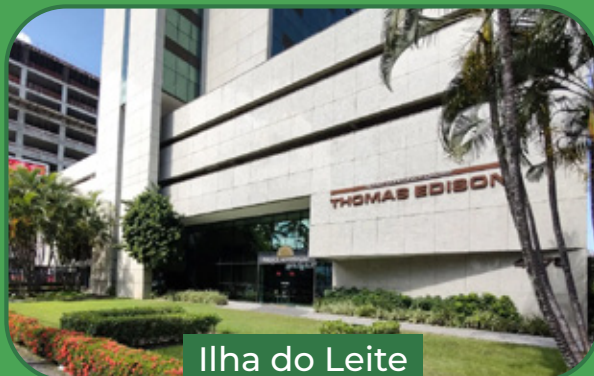
Ilha do Leite